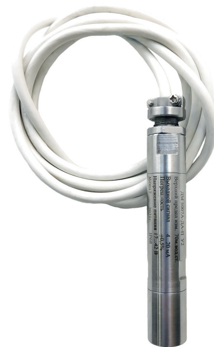
Рис. 3. Погружной датчик гидростатического давления ДМ5007А-ДА-П